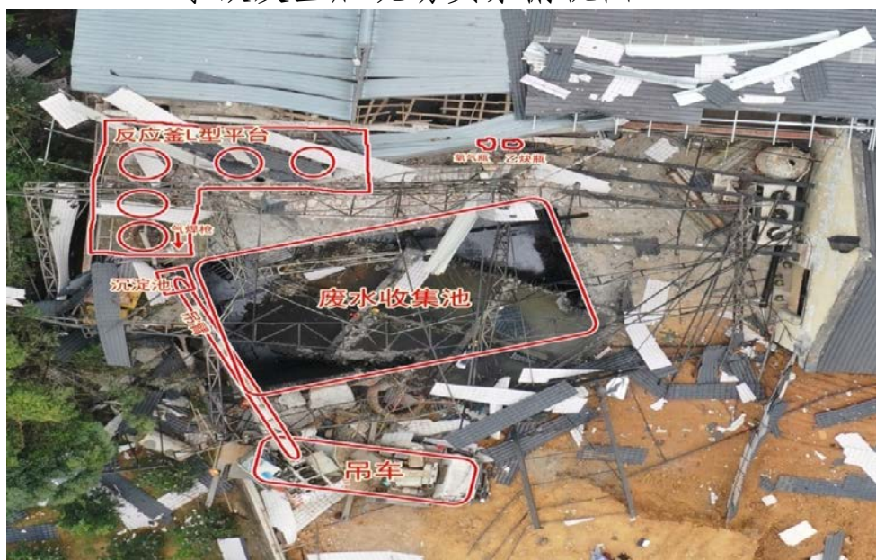
事故发生后现场实景俯视图：

燃爆事故发生后，厂房发生坍塌，坍塌面积约 300 平米（长 25 米、宽 12 米），燃爆造成彩钢瓦片和飞散物呈圆形飞出散落在周边屋顶和地面上，飞散物直线最远距离飞出约 200 米。废水收集池盖板（盖板为钢筋混凝土材质，厚度约 20 厘米）翻倒在池内，池周边呈燃烧熏黑和钢筋混凝土爆炸撕裂的痕迹。吊车垫板位于废水收集池与 10 号库房通道口中心位置。地面上有坍塌的钢梁和钢架。9 号库房与事故现场连接墙体、屋顶边缘及 10 号库房两侧玻璃均呈现有爆轰波冲击痕迹。